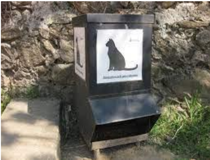
Menjador identificat en una colònia Font Google