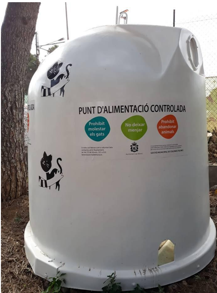
Punt d'alimentació i a la vegada refugi per als gats