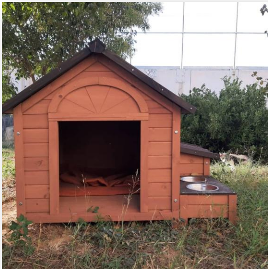
Caseta de fusta, colònia controlada La Roca del Vallès (Quatre Camins) (Font Gats La Roca)