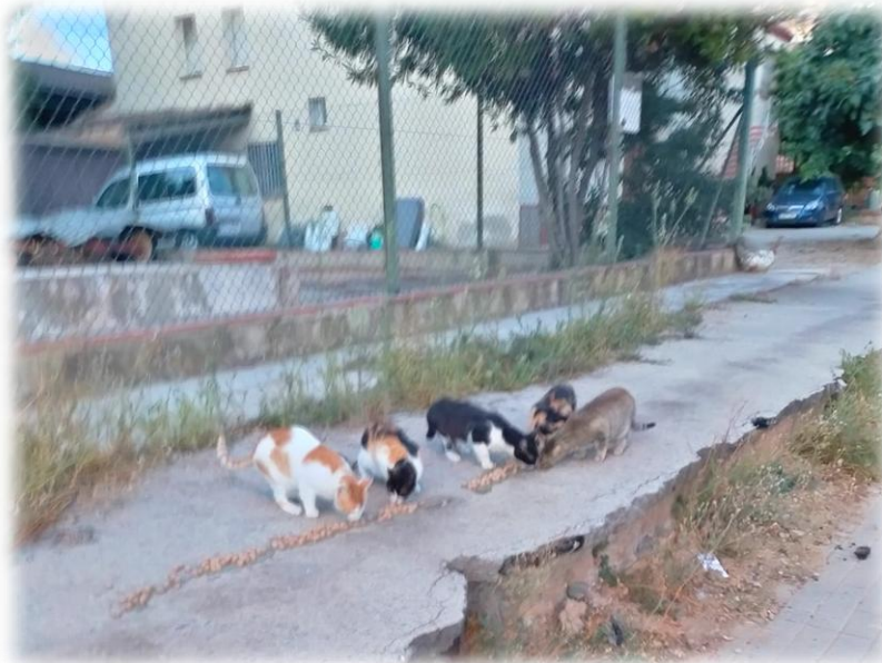
Colònia de gats “del Pagès”, Granollers.