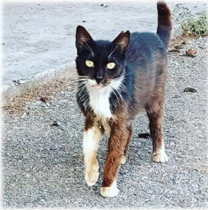
Gat a la colònia “del Pagès”, Granollers. Es veu la orella marcada en forma de V