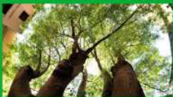
Llistoner al carrer de Jaume Carriera

Hi ha un total de 19.000 arbres als carrers de Granollers, i el llistoner és el més comú.