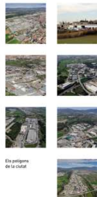
Els polígons de la ciutat

I ara contindrà productes per a col·lectius vulnerables per la covid.