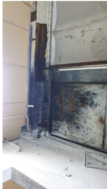
Accés al local