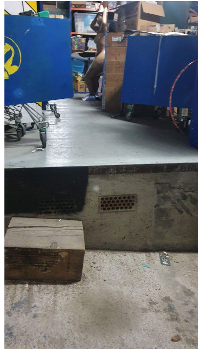
Sostre del local