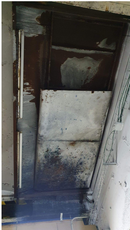
Sostre del local amb enllumenat que no funciona