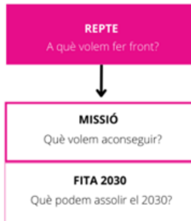
Figura 2. Desplegament de les missions